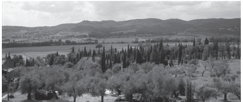
Blutig: Schauplatz der Welt-Geschichte 217 v. Ch., wo am Uferstreifen des Trasimenischen Sees bei Tuoro Karthager und Römer um die Vorherrschaft im Mittelmeerraum kämpften.

Aufklärungsmeldungen sind üblicherweise widersprüchlich, lückenhaft. Der militärische Führer braucht Instinkt, um Lage gerecht entscheiden zu können. Da setzte Hannibal an. Mittels Wachtfeuer und Truppenschleier simulierte er Marsch und Lager seiner Truppen ca 20 km weit vom römischen Heer entfernt. Konsul Gaius Flaminius, Befehlshaber der römischen Arezzo-Armee, galt als tüchtiger, redestarker Politiker, als risikofreudig, impulsiv, übersichtlich im Chaos, doch unerfahren als Truppenführer. Flaminius erkannte die Falle des Karthagers nicht. Roms Legionäre zogen also zum Trasimenischen See, dann auf der neuen römischen Straße am Nordufer entlang in der vermeintlichen Verfolgung Hannibals. Tatsächlich wählte Hannibal den schmalen nördlichen Uferstreifen des Trasimenischen Sees, die Römer auf dem Marsch zu schlagen.