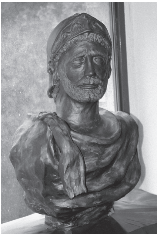
Hannibal. Büste in Tuoro

Im Jahre 218 v. Ch. bedrohte und eroberte Hannibal die am Ebro gelegene, römisch-verbündete Stadt Sagunt. Rom verlangte die Auslieferung Hannibals. Karthago lehnte ab. Rom erklärte den Krieg. Hannibal marschierte mit 50.000 Mann Fußvolk, 9.000 Mann Reiterei und 37 Kriegselefanten über den Ebro, den wasserreichsten Fluss der Halbinsel und für die Römer die äußerste, nördliche Grenze des karthagischen Einflussbereiches. Das machtvolle Heer überschritt die Pyrenäen. Hannibal wich im Rhônetal geschickt römischen Truppen aus und überquerte mit hohen Verlusten die Alpen. So entwickelte sich der Zweite Punische Krieg. Mit wenigen Elefanten und 26.000 Mann erreichte Hannibal das von romfeindlichen Kelten bewohnte Oberitalien. Am linken Po-Nebenfluss Tesin schlug er im Herbst 218 ein römisches Heer.